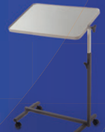
Beistelltische / Bettische