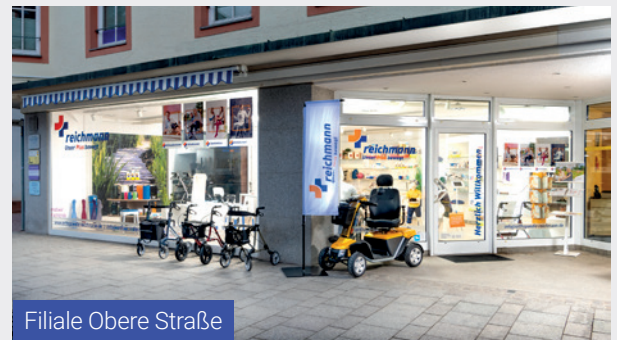
Filiale Obere Straße