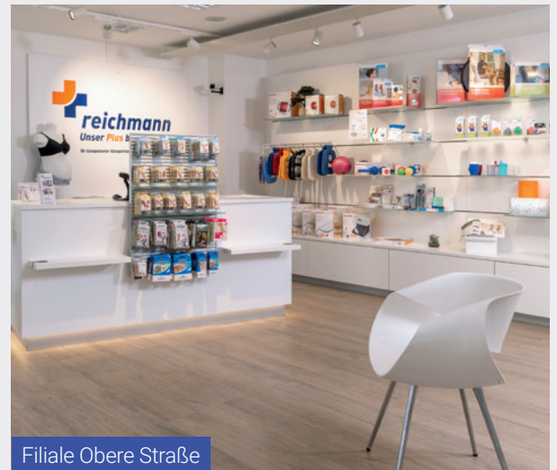
Filiale Obere Straße

Schauen Sie doch auch einmal auf unserer Website vorbei und entdecken Sie unser umfangreiches und vielfältiges Angebot! Oder wie wäre es mit einem Besuch vor Ort? Denn schließlich führt nichts schneller zu einem Plus an Lebensqualität als das Gespräch von Mensch zu Mensch.