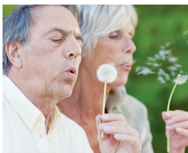
30 | Medizintechnik