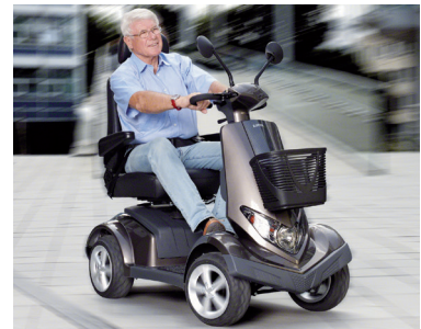
15 | Scooter