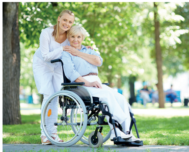
9 | Rollstühle