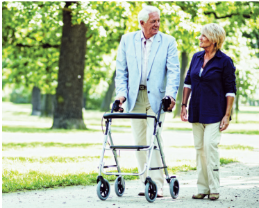
4 | Gehhilfen