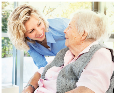
23 | Dekubitusprophylaxe