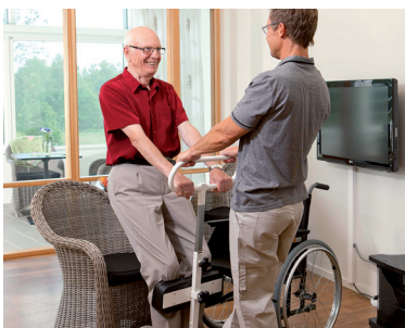
28 | Transfersysteme