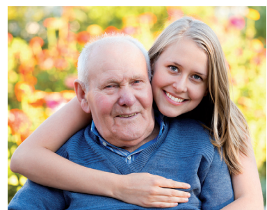
32 | Pflegehilfsmittel & Weitere Produkte