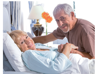
26 | Pflegebetten